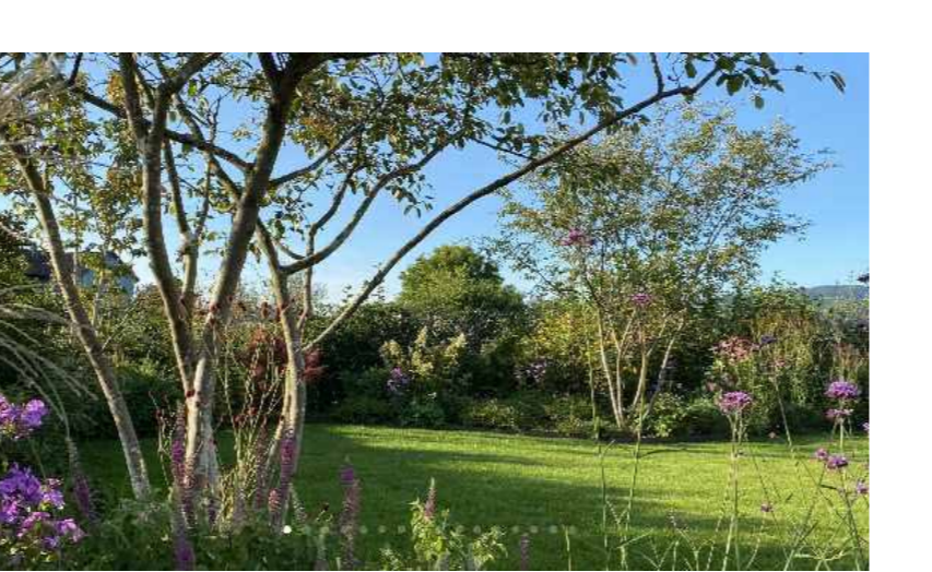
Private Rasenflächen mit Bäumen