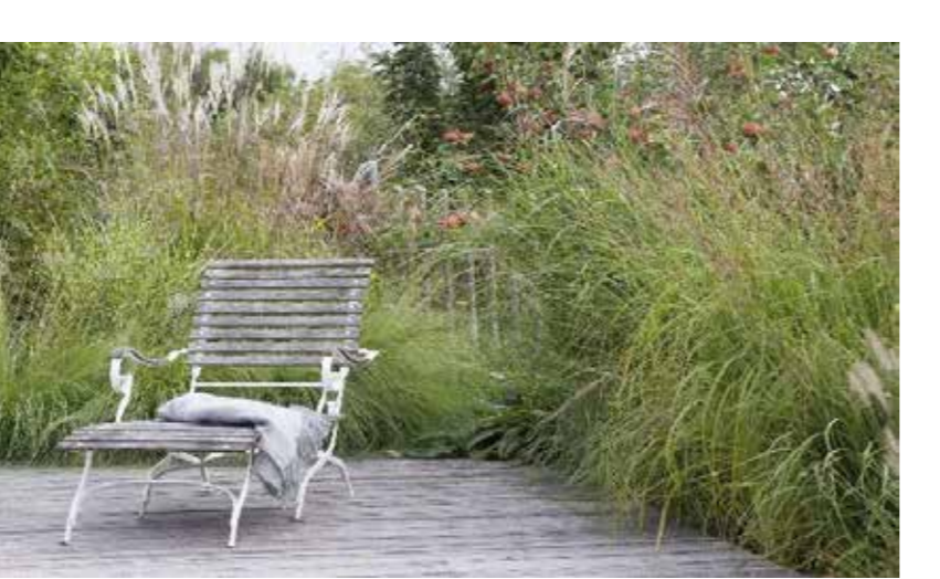
Hoch wachsende Blütenstauden und Gräser als Sichtschutz im privaten Aussenbereich