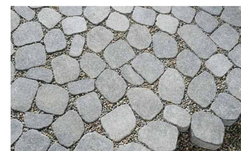
Sickerfähiger Belag aus Verbundsteinen, mit Kiesfugen