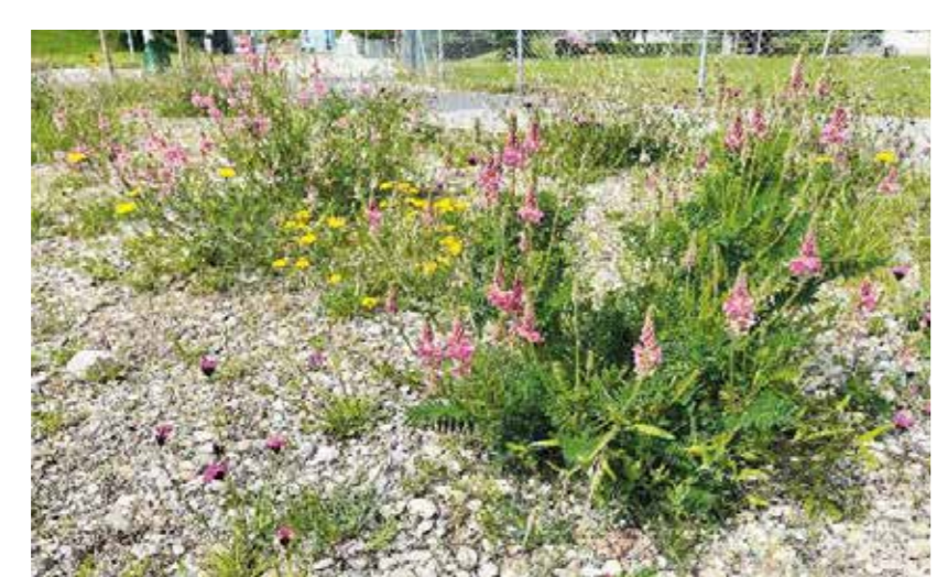
Ruderale Kiesfläche beim Spielplatz