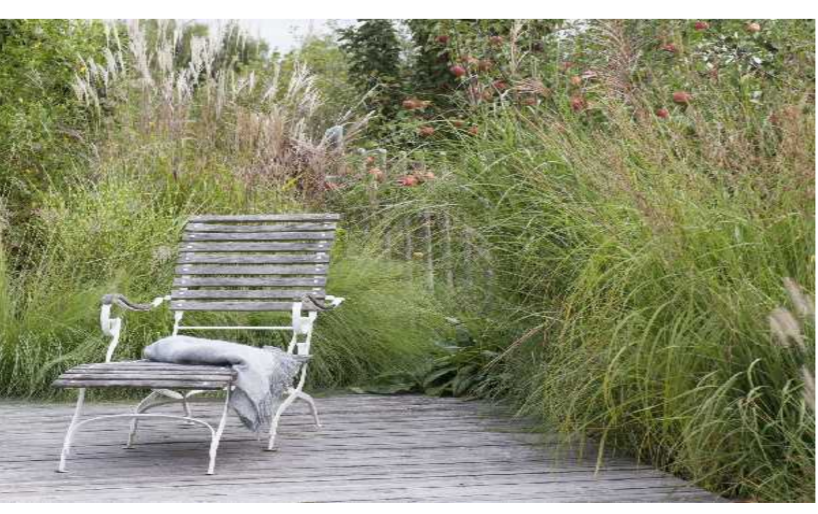
Hoch wachsende Blütenstauden und Gräser als Sichtschutz im privaten Aussenbereich