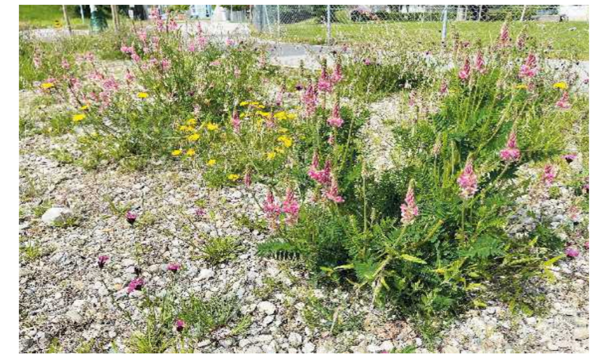
Ruderaler Kiesfläche beim Spielplatz