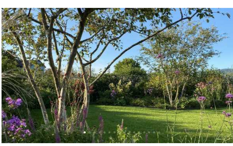
Private Rasenflächen mit Bäumen