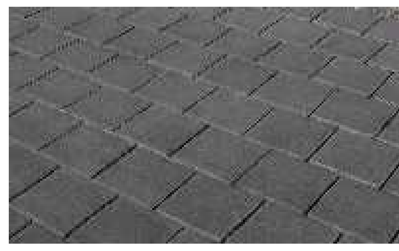
Sickerfähiger Belag aus Verbundsteinen